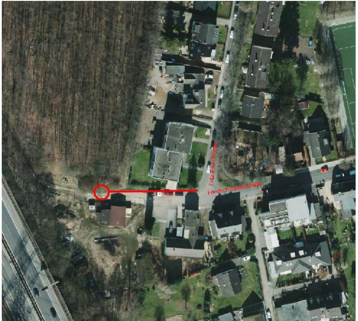
Bauvorhaben: Umbau Schacht am Ende der Friedrich-Ebert-Straße